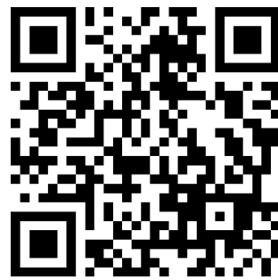
Onze etalages in de binnenstad